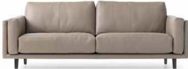
Leolux Bellice Design: Beck Design, 2017