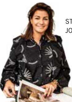
STYLIST: JOYCE VOS